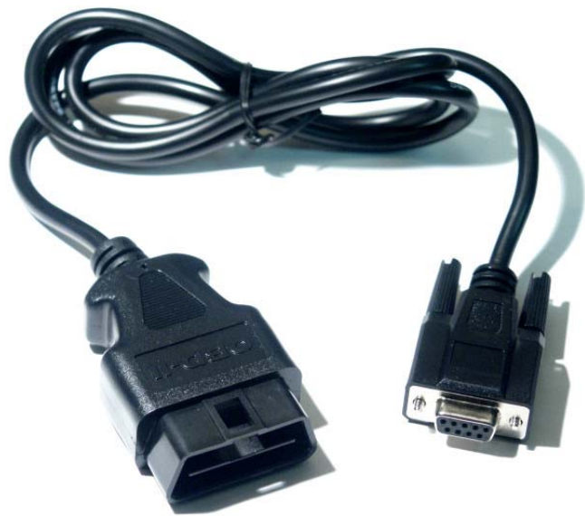
Cable con conector de diagnostico OBDII con terminación en conector serie RS232C que permite su conexión aun ordenador o equipo que posea el software de comunicación.

El OBD verifica el correcto funcionamiento del sistema de aire secundario analizando la tensión generada por las sondas lambda, (menor tensión) puesto que la inyección de aire aumenta la cantidad de oxígeno en los gases de escape. La detección por parte de la unidad